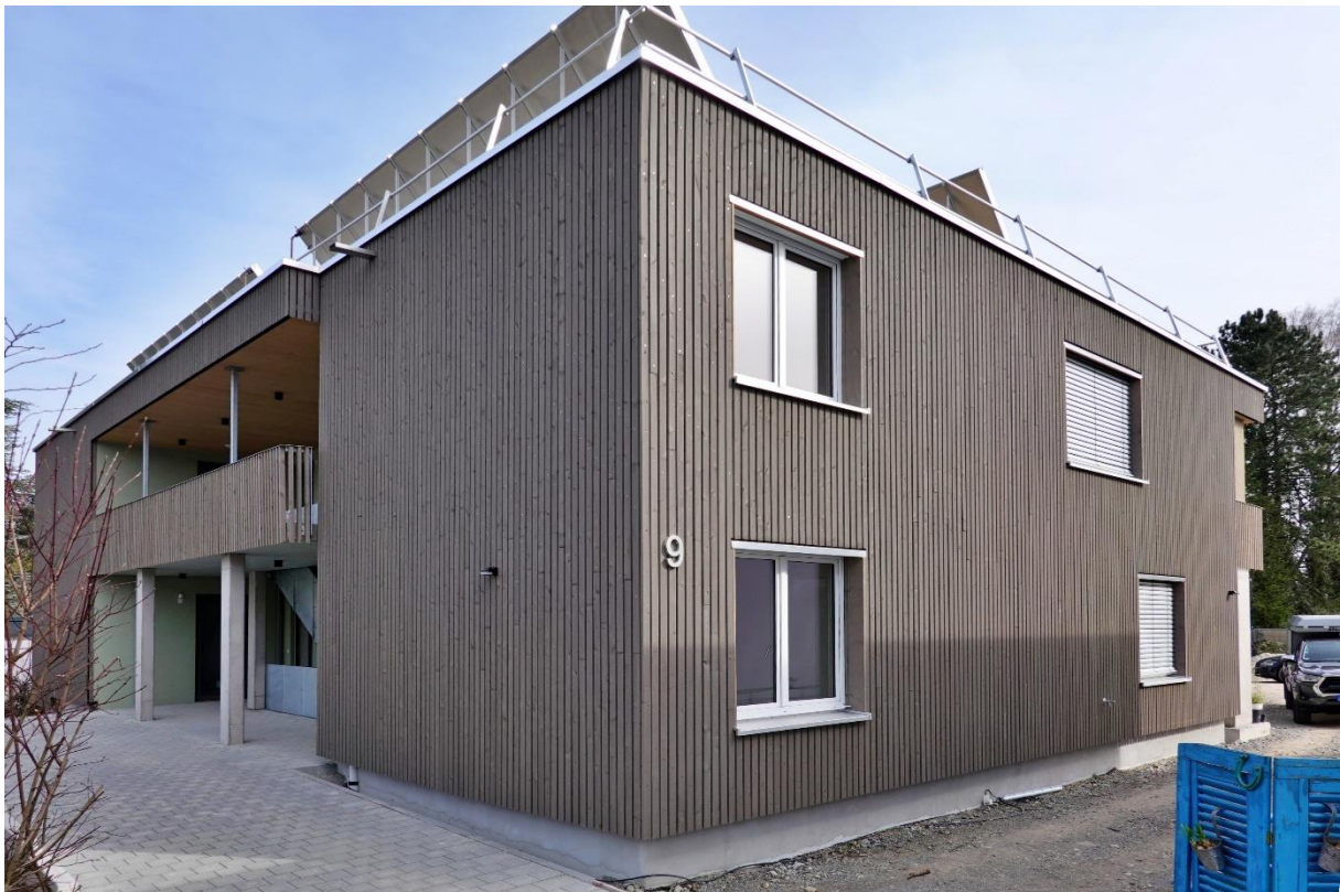
Abbildung 1 Pfrondorfer Neschtle

Das gemeinschaftliche Senior:innen-Wohnprojekt- ist barrierefrei nach DIN 180402 konzipiert und wirkt durch großzügig gestaltete Begegnungsflächen der zunehmenden Vereinsamung im Alter aktiv entgegen. Energetisch erfüllt das Gebäude den KfW- Effizienzstandard- 55, wobei 75 % der Wärme über Solarthermie bereitgestellt werden.